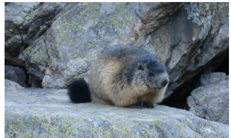
Marmotte du Lauvitel – Christophe Delaere (CC-BY)

Créée en 1995, la zone est depuis interdite d'accès en dehors des personnes impliquées dans les suivis scientifiques. Son classement a permis la réalisation d'un premier état des lieux entre 1995 et 2000 pour connaître au mieux sa biodiversité et les milieux présents. Plus de 3200 espèces y ont été répertoriées. Depuis, des relevés sont régulièrement effectués pour comprendre l'évolution des écosystèmes de la zone : faune, flore, forêt, hydrologie, climat,... tous ces paramètres sont étudiés précisément.