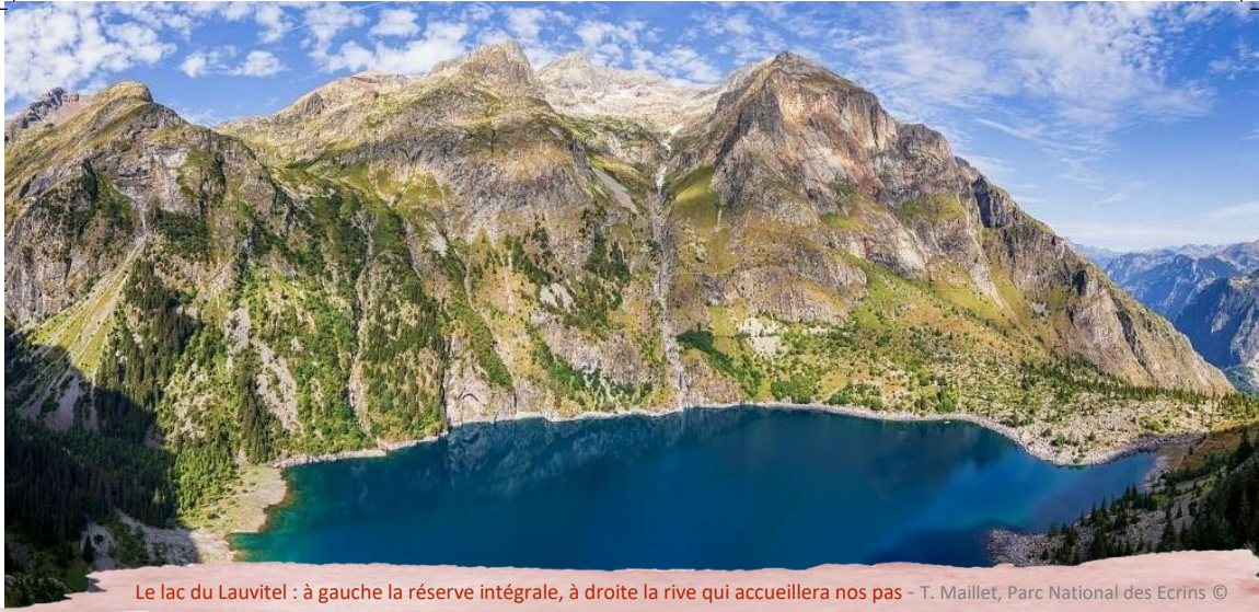
Le lac du Lauvitel : à gauche la réserve intégrale, à droite la rive qui accueillera nos pas