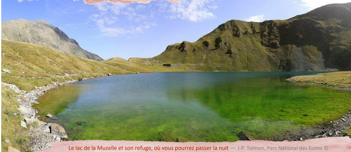
Le lac de la Muzelle et son refuge, où vous pourrez passer la nuit