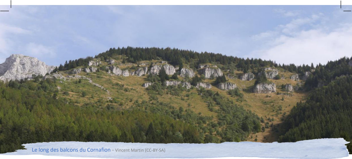
Le long des balcons du Cornafion - Vincent Martin (CC-BY-SA)