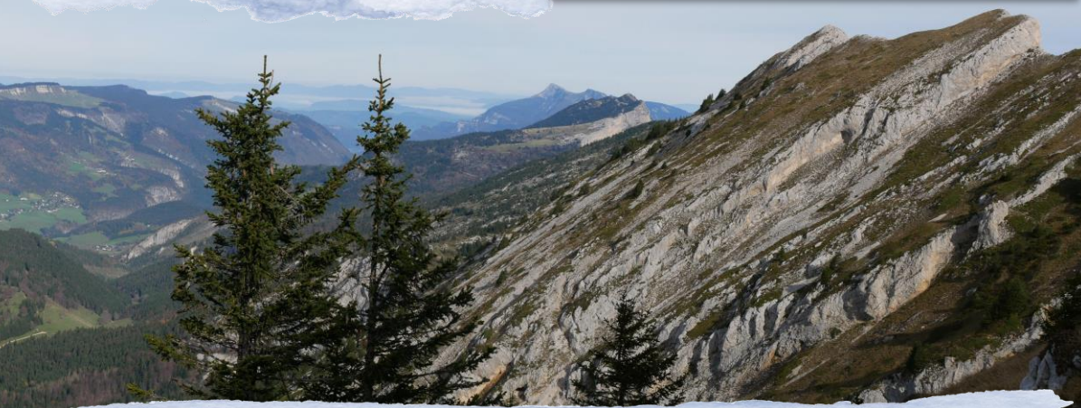
Vue depuis la Combe Chaulange - Vincent Martin (CC-BY-SA)