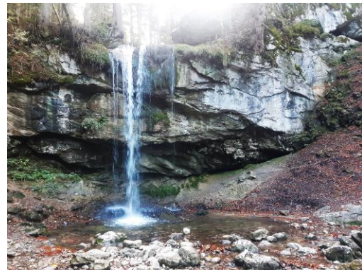
Cascade de la Fauge

La seconde est une concrétion en tuffe, cascade pétrifiante, visible sur la rive droite au pied de la cascade. Elle résulte du retour à l'air libre d'eau chargée en calcaire qui se solidifie au contact de l'air. Le massif du Vercors est karstique, composé de roche calcaire qui se dissout sous l'action de l'eau acide. Le calcaire dissous ruisselle dans les profondeurs avant de ressortir à l'air libre où il peut se solidifier à nouveau et former ainsi des cascades de roches.