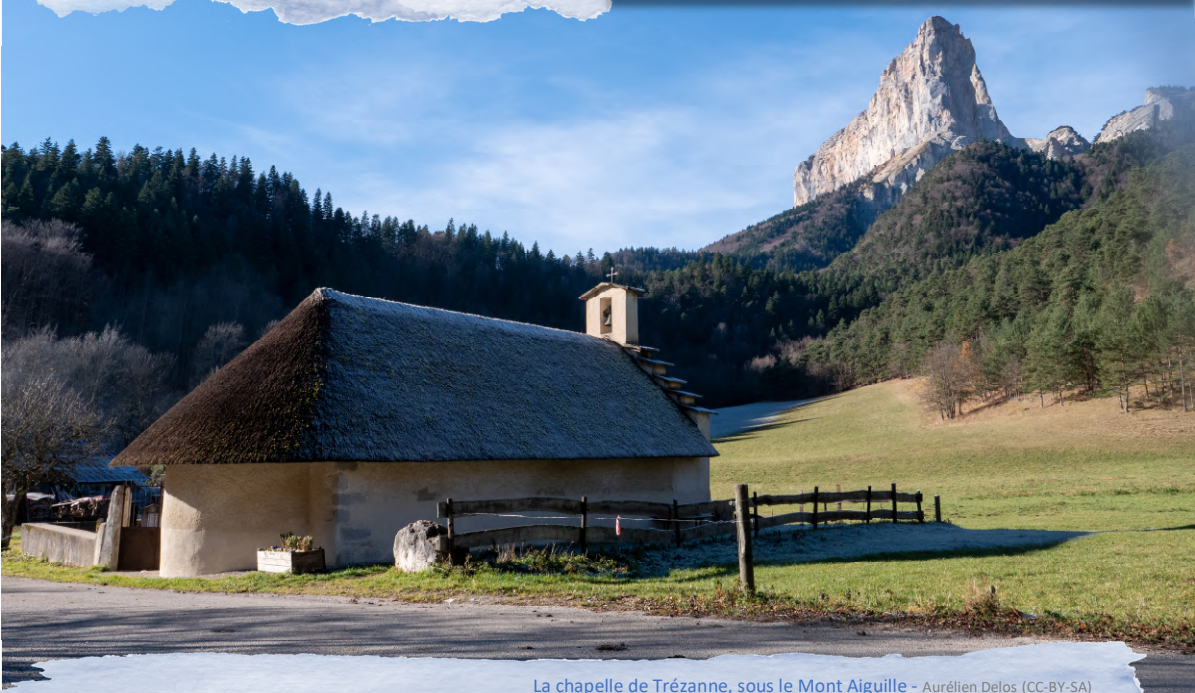
La chapelle de Trézanne, sous le Mont Aiguille