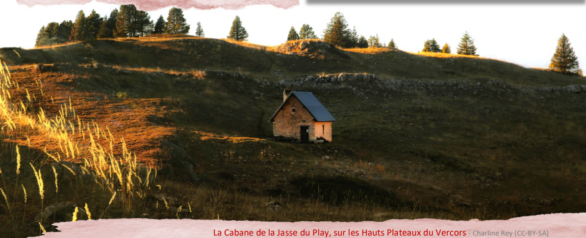
La Cabane de la Jasse du Play, sur les Hauts Plateaux du Vercors